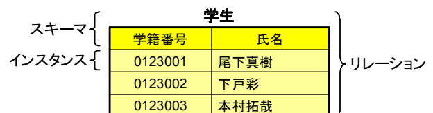
図2 リレーションの例

スキーマとインスタンスの関係は、Javaのクラスとオブジェクトの関係に近い。Javaでは、ある概念がどのような情報(変数)を持つかをクラスとして定義し、そのクラスのオブジェクトを必要に応じて複数生成することでプログラムを実現する。つまり、Javaのクラスがデータモデルのスキーマに対応し、オブジェクトがインスタンスに対応することになる。